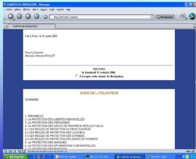
Journées du CISME 2006 - Exemple de Charte Informatique