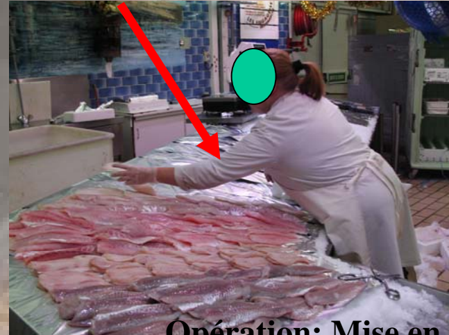
Opération: Mise en rayon Déterminant: Étal trop profond