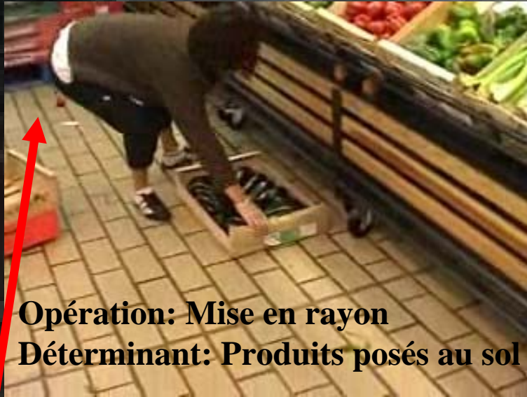
Opération: Mise en rayon Déterminant: Produits posés au sol