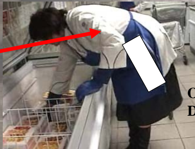
Opération: Mise en rayon Déterminant: Bac trop profond